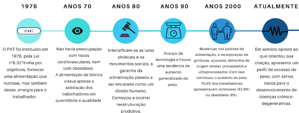
Figura 3. EVOLUÇÃO HISTÓRICA DO PAT

Legenda: PAT – Programa de Alimentação do Trabalhador.